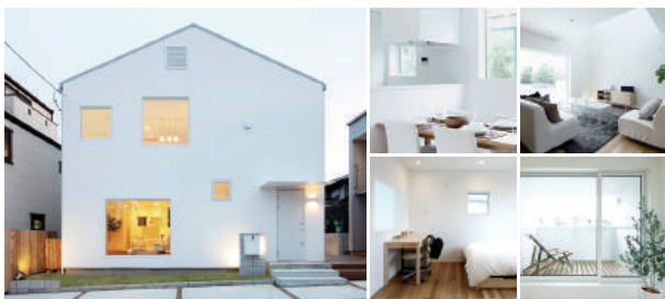
無印良品の家 宝塚店