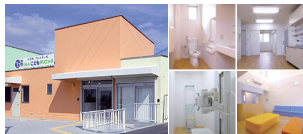
いいこどもクリニック