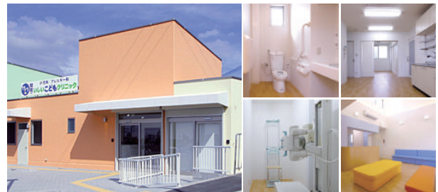
いいこどもクリニック